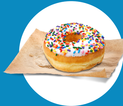
Use pañuelos desechables