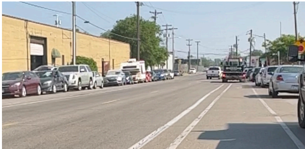
Tej Uas Tshwm Sim Tam Sim No – Kev North 2nd Street

Tes haujlwm no yuav tsim txuas ob txoj kev caij tsheb khaub vab ntawm kev 2nd Street N nruab nrab kev Dowling Ave N mus txog Plymouth Ave N. Txoj kev caij tsheb khaub vab uas muaj ntug thaiv no yuav hloov txoj kev caij tsheb khaub vab ntawm kev 2nd Street. Txoj kev caij tsheb khaub vab ntawm kev tam sim no tsis muaj kev tiv thaiv cov neeg txaus los ntawm tej tsheb ntawm kev. Ntawm cov kev sib tshuam uas muaj teeb, tes haujlwm no yuav muaj tej ntug los tiv thaiv thaum nyob ntawm kev sib tshuam. Tes haujlwm no yuav txuam nrog ob txoj kev caij tsheb khaub vab uas los ntawm tes haujlwm ntawm kev Dowling thiab 2nd Street N sib tshuam. Nws kuj yuav txuas nrog lwm cov kev tshiab thiab mus tshab cov kev tseem tsim txuas uas yog Upper Harbor Regional Park thiab lwm cov kev caij tsheb khaub vab uas tseem yuav muab tiv thaiv tom ntej no.